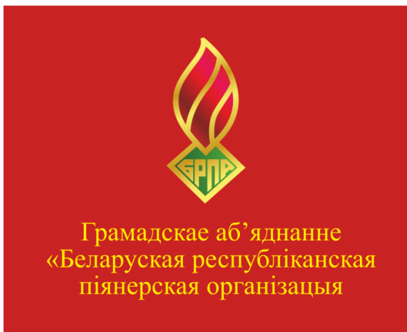
Знамя ОО «БРПО» (лицевая сторона)