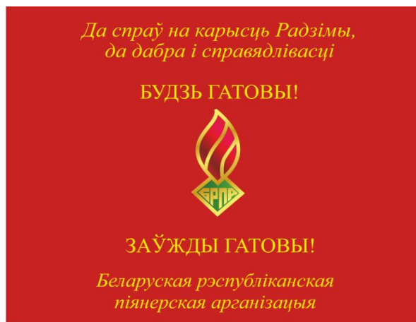
Знамя областной (Минской городской) пионерской организации (лицевая сторона)