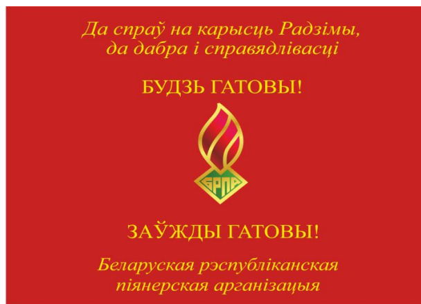
Знамя районной (городской) пионерской организации (лицевая сторона)