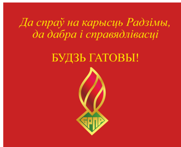
Знамя ОО «БРПО» (оборотная сторона)