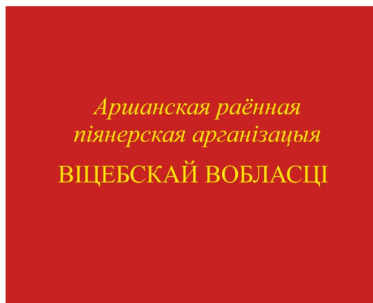
Знамя районной (городской) пионерской организации (оборотная сторона)