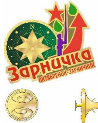
Новая визуализация БРПО, талисман БРПО