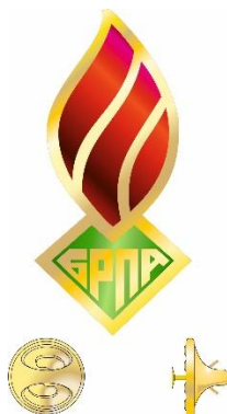
Значок «Центральный Совет»