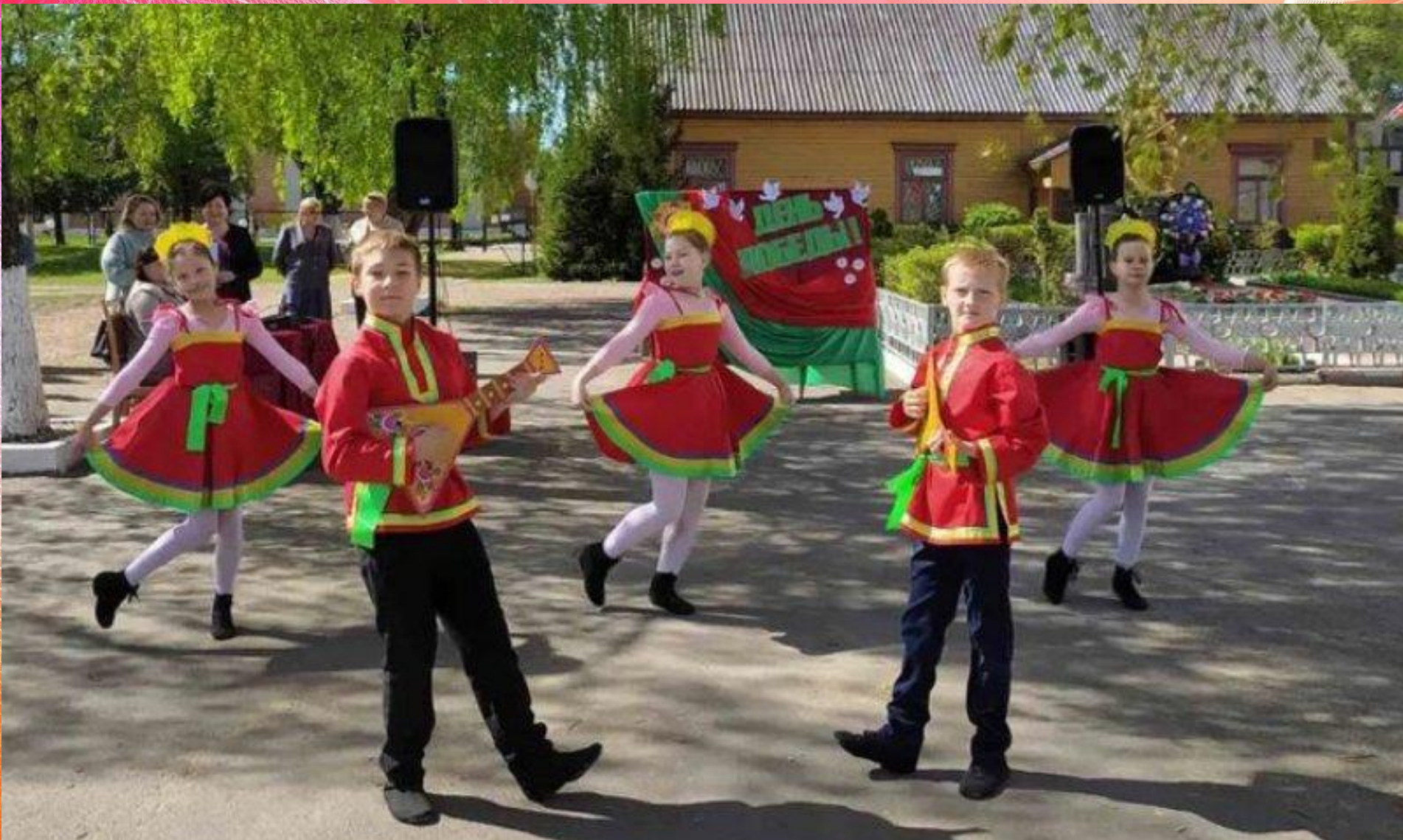
Выступление танцевального коллектива «Радость» 2022г.