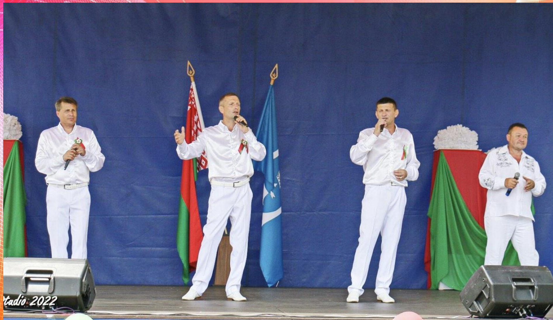
Народный ансамбль народной песни и музыки «Шляхтичи»