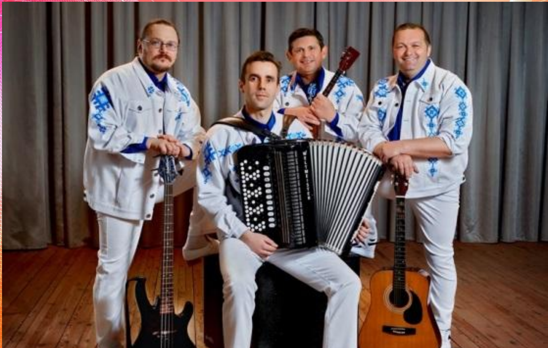
Ансамбль народной песни и музыки «Прымаки»