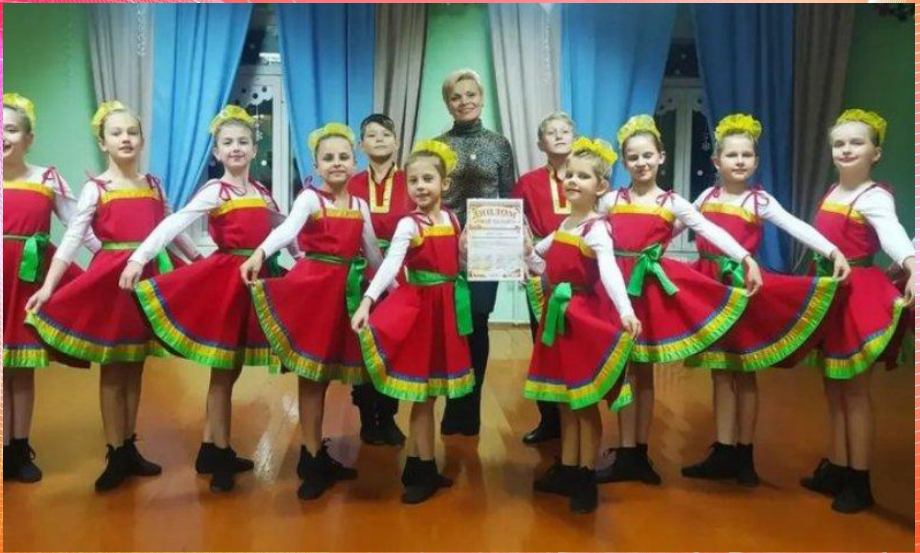
Танцевальный коллектив «Полесские задоринки»