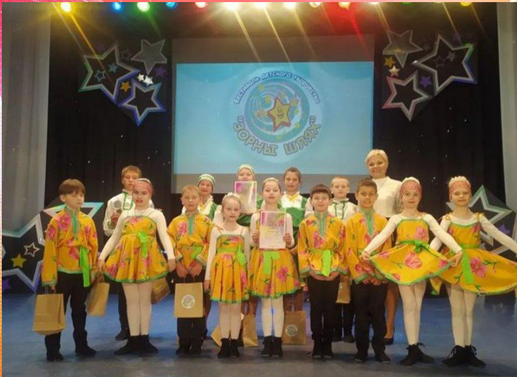
Танцевальный коллектив «Полесские задоринки». Фестиваль детского творчества «Зорны шлях»- 2023