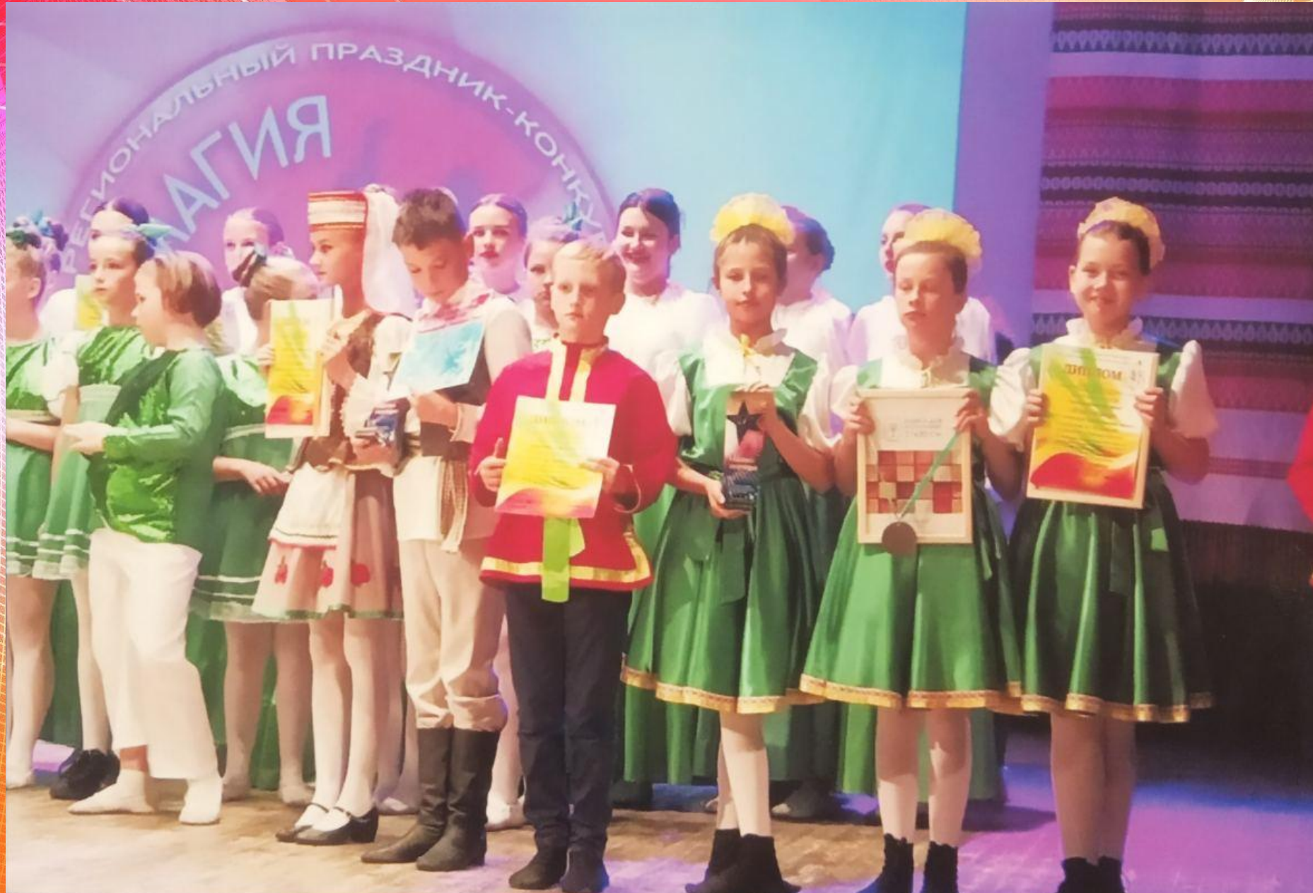
Танцевальный коллектив «Полесские задоринки» в числе победителей конкурса «Магия танца» г. Пружаны 2022г.