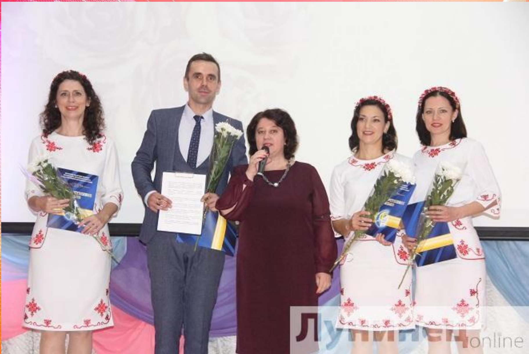
Народный ансамбль «Весница»