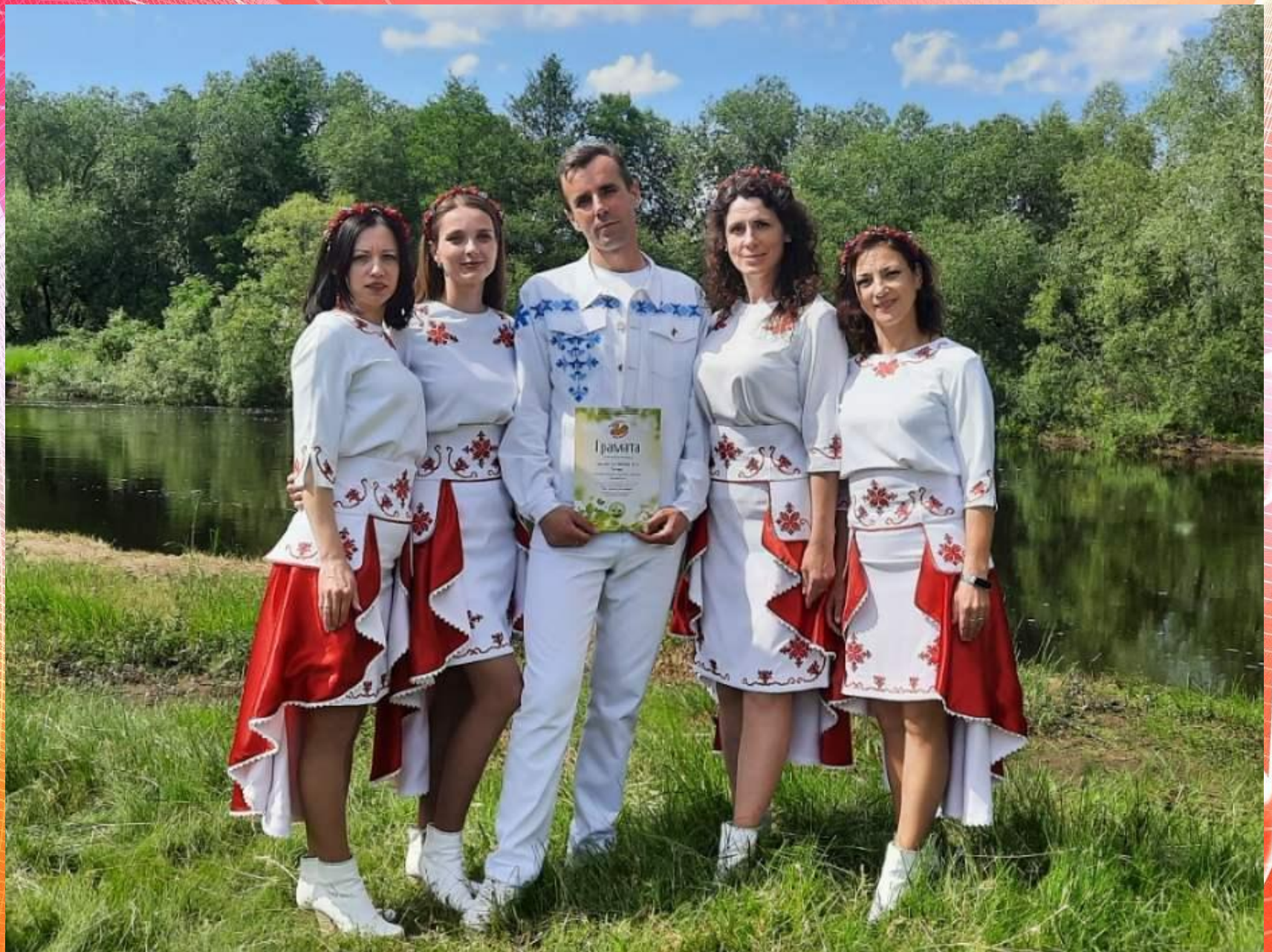
Народный ансамбль «Весница»