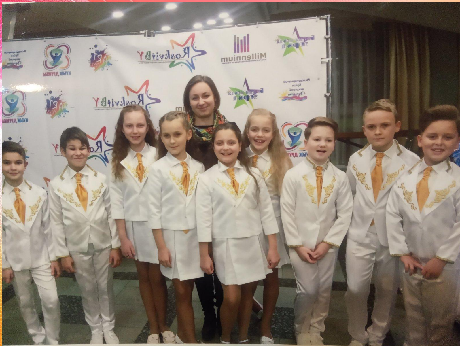
Вокальный ансамбль «Планета детей». Участники и победители многочисленных районных, областных, республиканских и международных конкурсов.