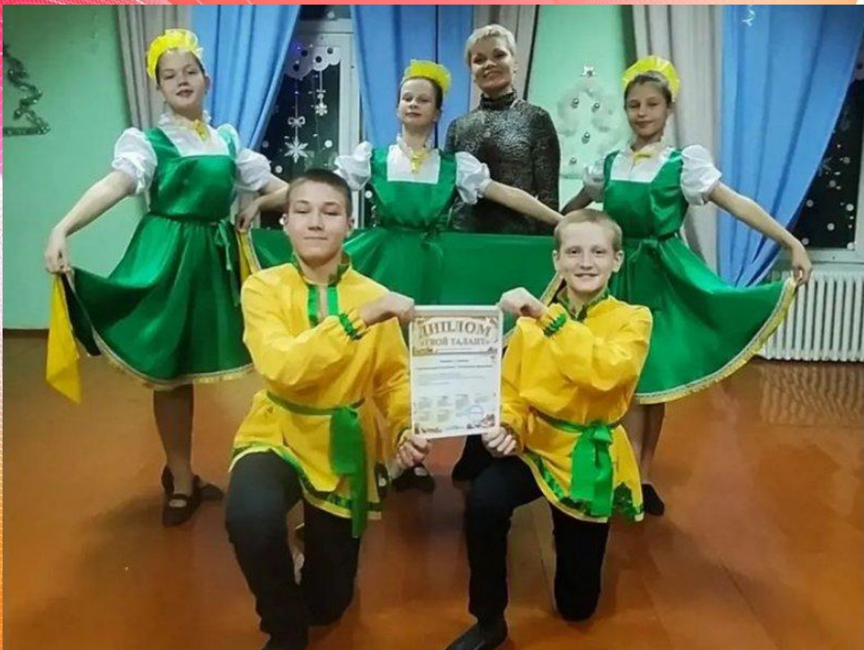
Танцевальный коллектив «Радость»