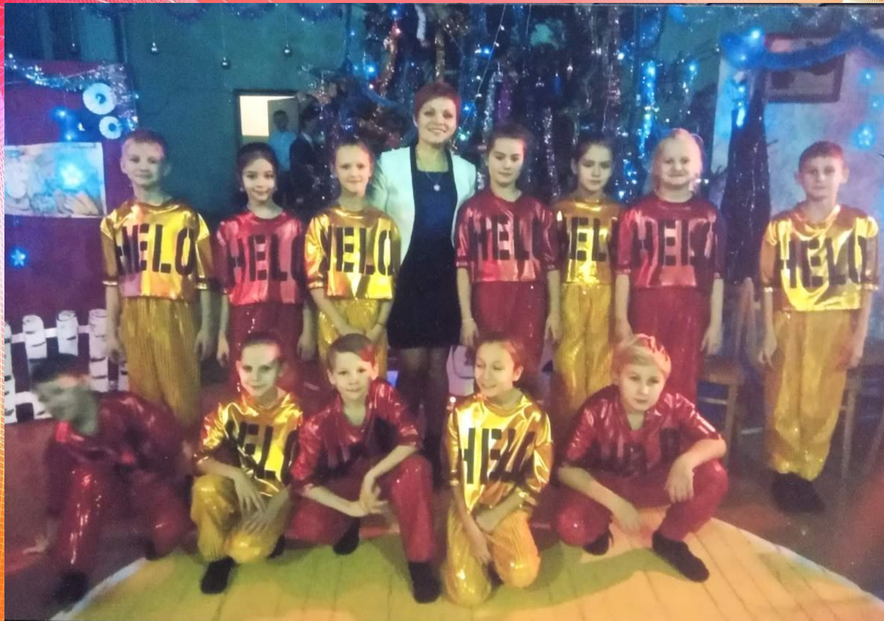
Участники эстрадного танца «Новое поколение»