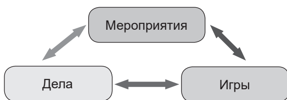
Рисунок 1. — Основные формы воспитательной работы

Необходимо отметить, что технология КТД высокоэффективна при подготовке и проведении коллективных творческих дел, но неприменима к отдельным видам воспитательных мероприятий. В связи с этим следует обратиться к классификации основных форм воспитательной работы Е. В. Титовой, в соответствии с которой выделяют мероприятия, дела и игры (рисунк 1). Они различаются по целевой направленности, позиции участников воспитательного процесса, объективным воспитательным возможностям [4; 5; 6; 7].